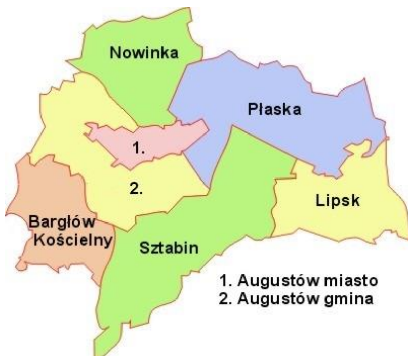
Rysunek 1. Gmina Bargłów Kościelny na tle powiatu augustowskiego